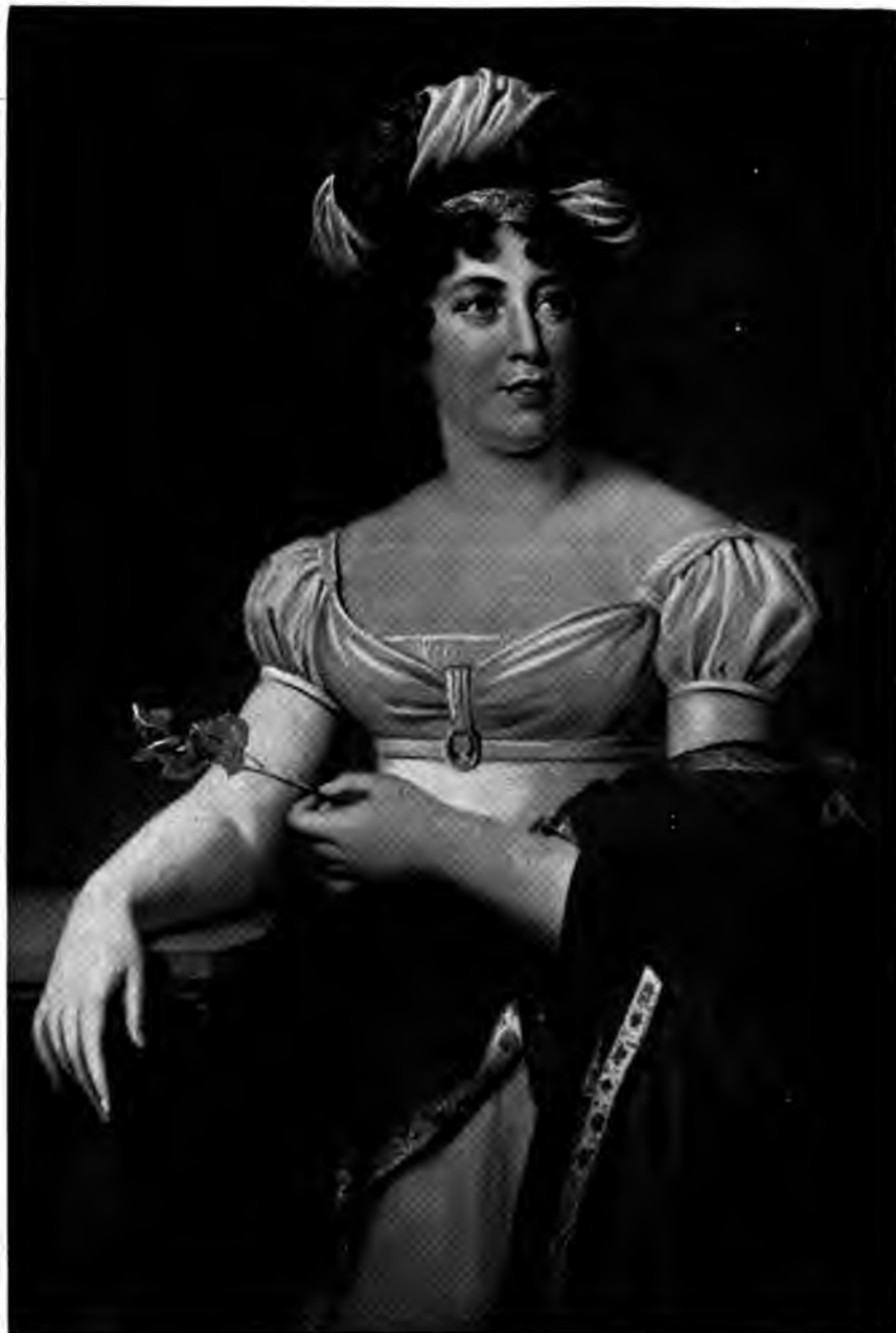
PORTRAIT DE MADAME DE STAEL d'après Girard.